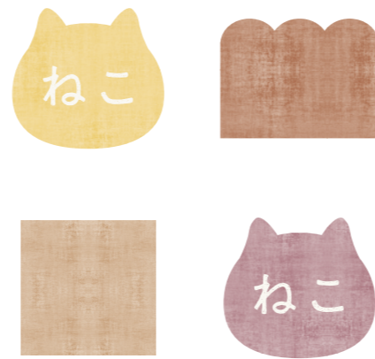
□ COMMUNICATION LOGO