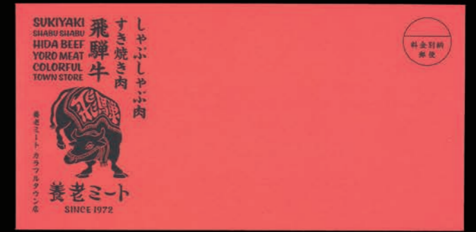
内覧会招待状：飛び出す絵本のようなしかけ