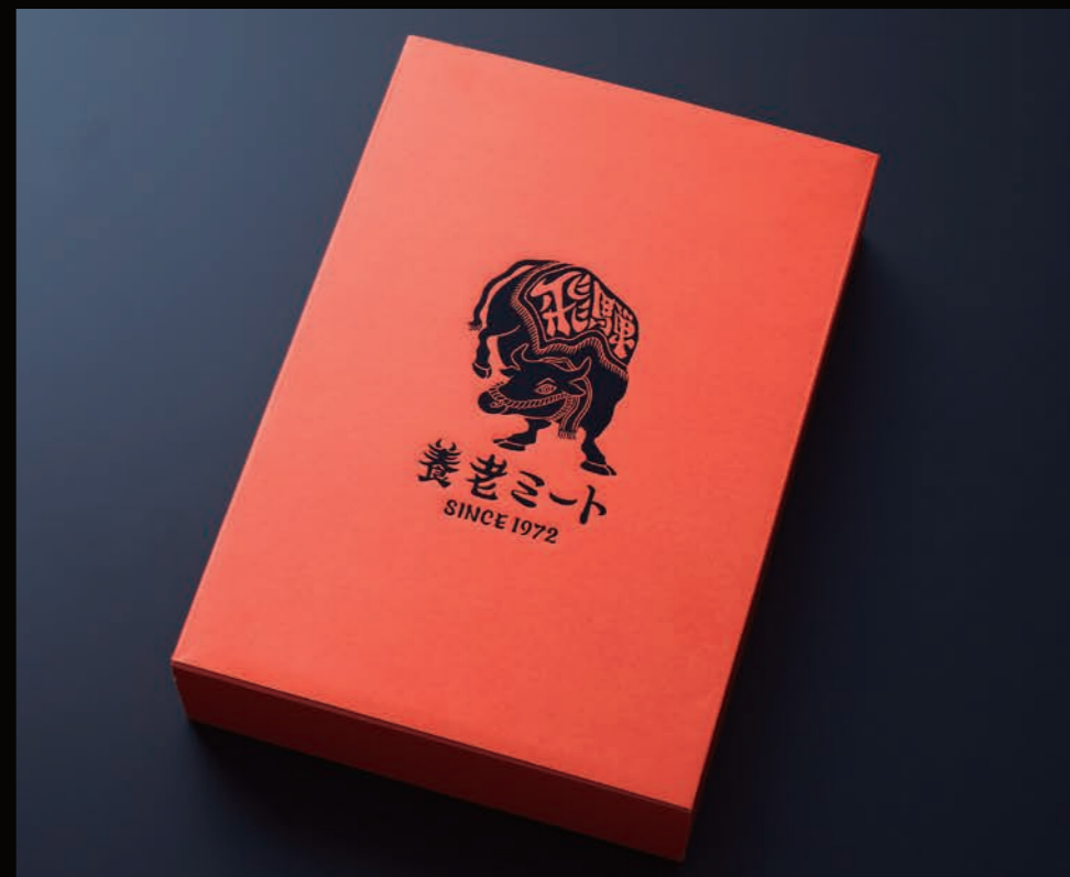
贈答用ギフトボックス