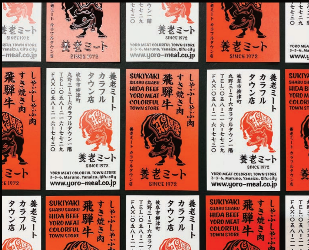
ショッピングカード