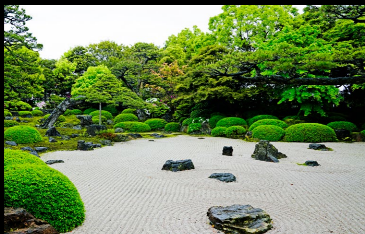
水を用いず、石や砂などのシンプルな素材で山水の風景を表現する。庭園様式の枯山水をパッケージに落とし込んだデザイン。

和菓子専門店 ohagi3 の新商品「小豆山水」。フリーズドライされた国産小豆を、チョコレートパウダーでコーティングしたお菓子です。パッケージデザインは、日本の風景を表現した庭園「枯山水」をモチーフに制作。味でも、目でも、国産小豆の自然な風味を楽しむ上質な和のお菓子であることを、パッケージ表面のエンボス加工で、シンプルに表現しています。また、パッケージを並べると模様につながり、面としても和の世界観を感じさせることができます。