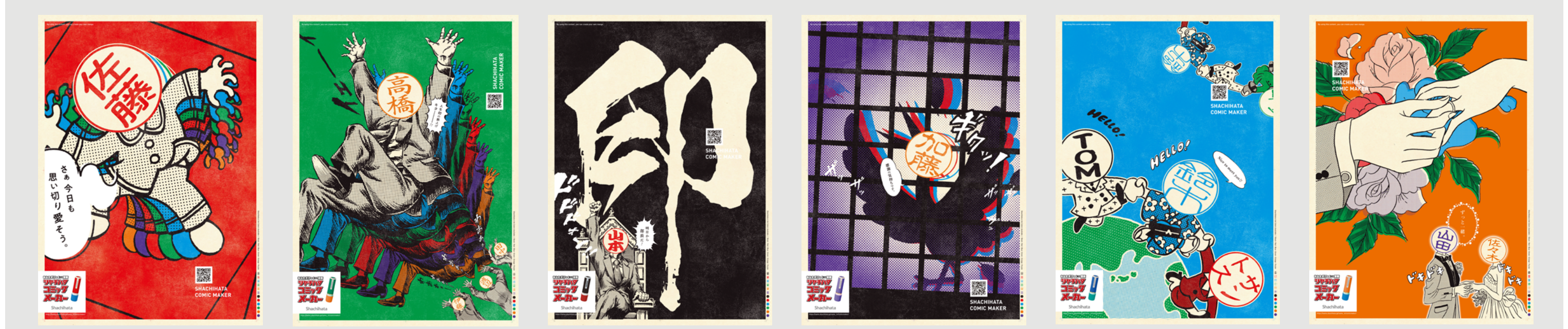
SNSキャンペーン賞品としてのオリジナルギフトポスター

BACKGROUND コロナ禍「脱ハンコ」の逆風 コロナ禍という前代未聞の社会情勢の中で推進されたデジタル化＝「脱ハンコ」の逆風を受けたシャチハタにとって、古来から日本の固有文化として一人ひとりのアイデンティティを示してきたハンコの価値を守り、伝えることは急務であった。同時に、ハンコのリーディングカンパニーとして社会に蔓延する閉塞感を吹き飛ばし、世の中を少しでも明るくしたいと考え、新しいハンコ体験エンターテインメントの構築に挑んだ。