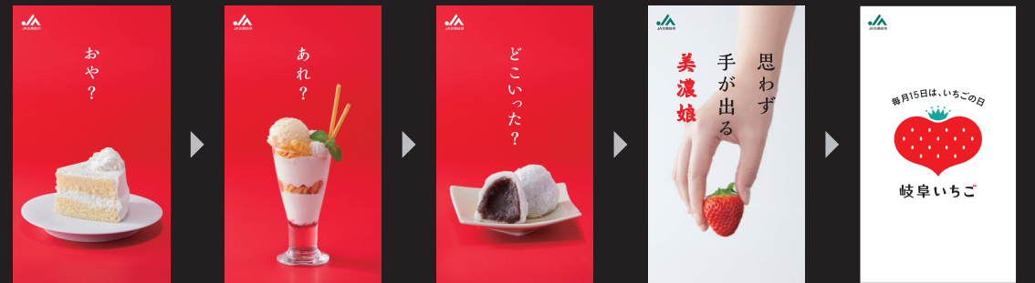
「美濃姫」サイネージ