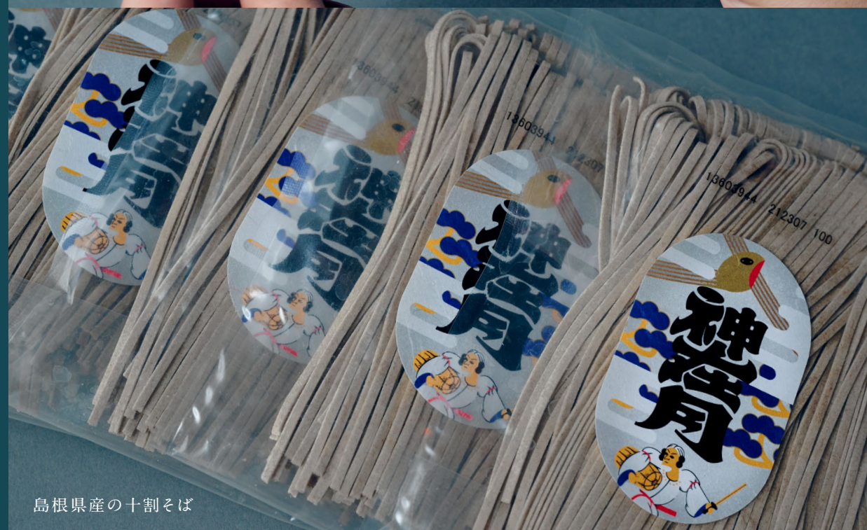
島根県産の十割そば