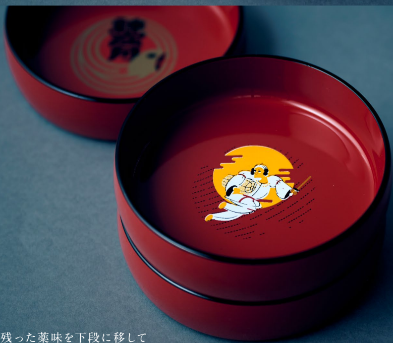
上段の残った薬味を下段に移して 味を変えていくのが出雲そばの食べ方