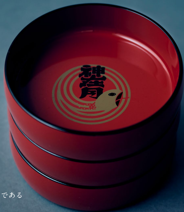
出雲そばの食べ方の特徴である オリジナルの割子3段