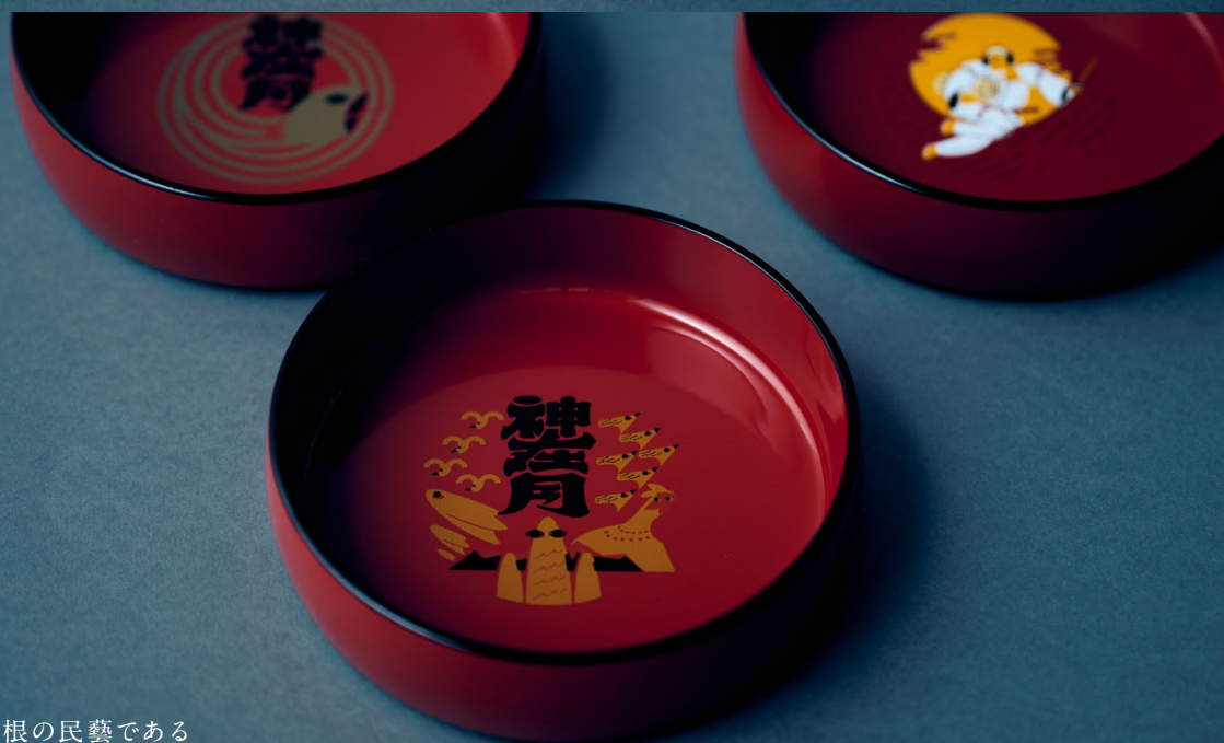
地元島根の民藝である 八雲塗という漆の技術で絵柄をプリント